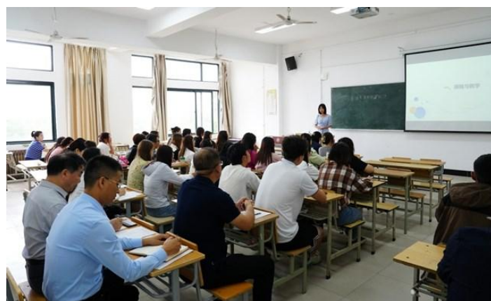
教务处、质评处深入课堂听课