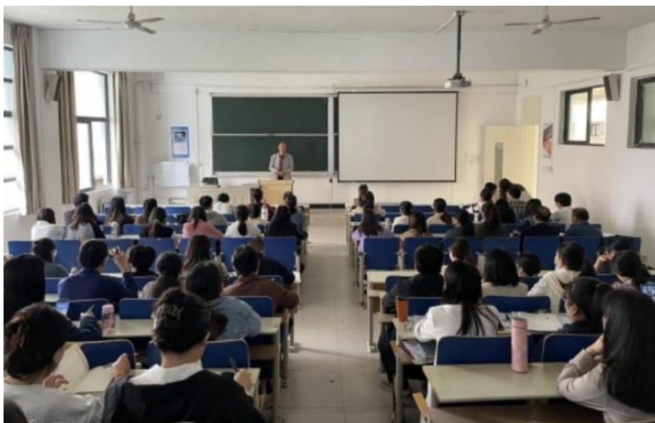
图 柴教授专题讲座(一)

为提高教师基本功板书设计教学能力,2023年9月27日下午14:30,我院邀请西安电子科技大学国家级二级教授柴常春博士进行“高校教师教学基本功板书设计专题培训暨经验交流”讲座。信息工程学院全体教师以及学校基础部、经济管理学院等多个学院教师代表共90人参加了本场讲座。