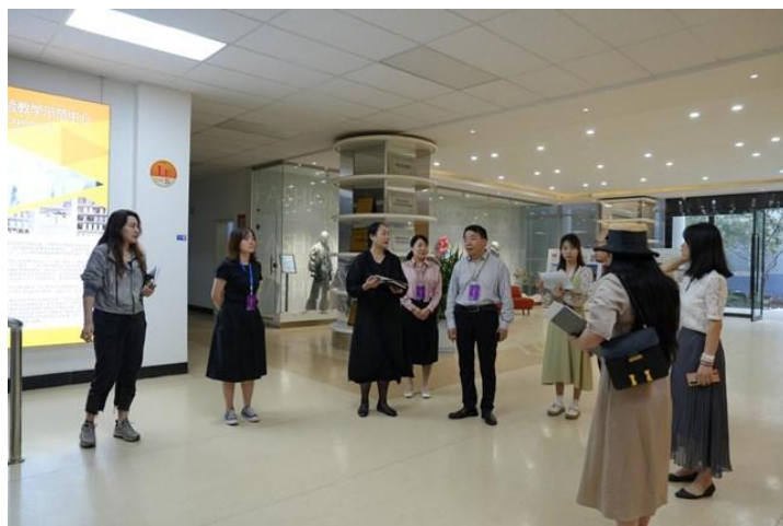
校领导带队检查开学第一课