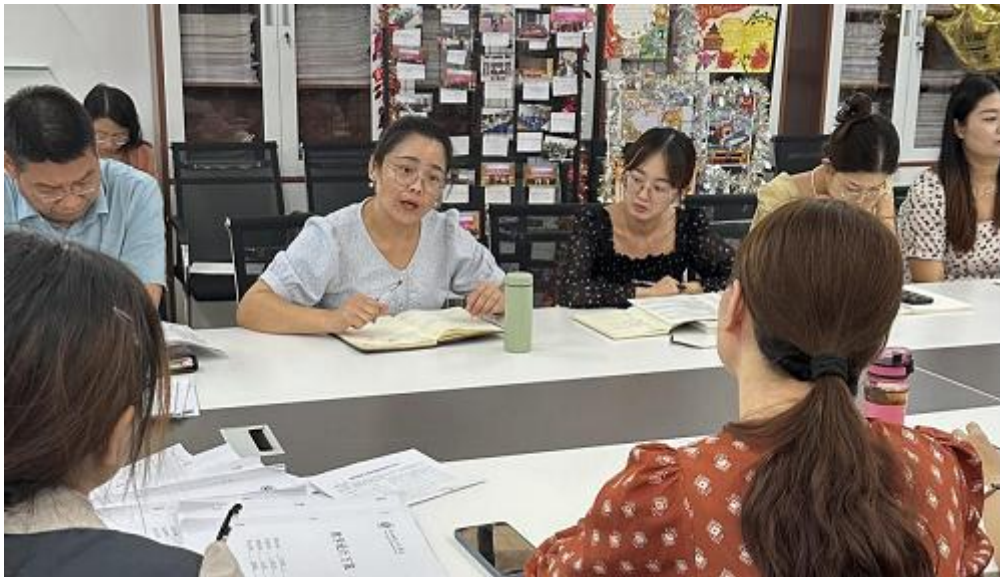
张蒙蒙老师分享教学心得

长来负责记录各成员的课堂表现。两位老师的经验分享为新老教师提供了切实可靠的参考建议。