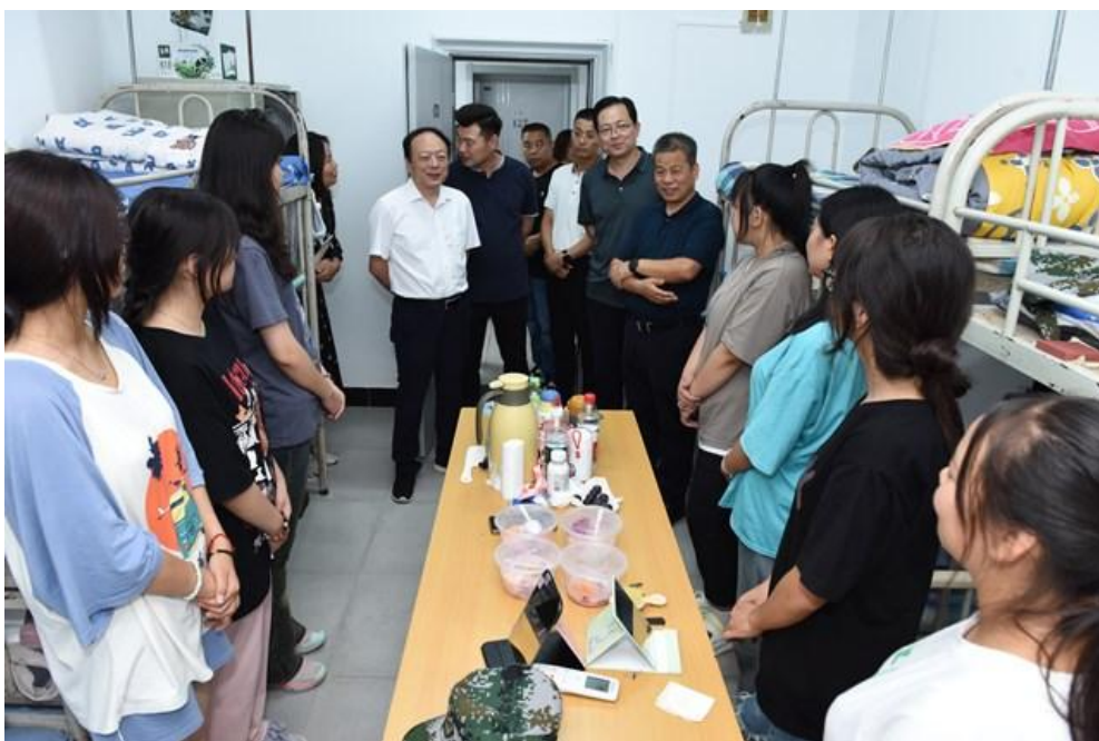
在校党政领导，职能处室工作人员参加了综合检查。