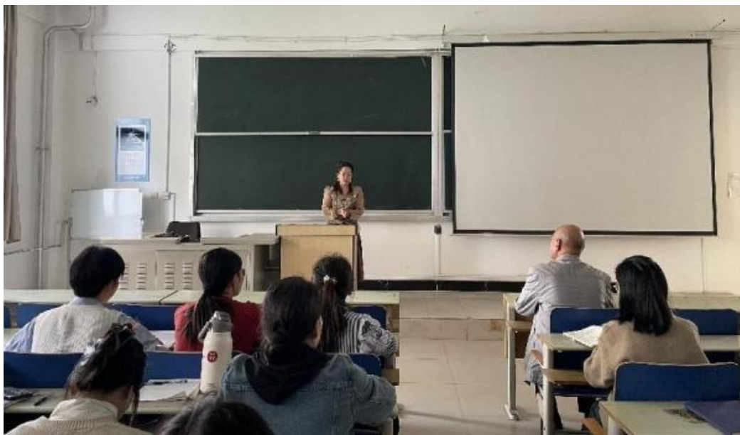
图 党小娟副院长介绍柴教授基本情况

接下来，柴教授结合 40 年的教学经历与体会，采用全板书授课方式进行“半导体物理学”第一次课程内容的示范性讲授，与大家分享纯板书教学方式在大学本科专业课程教学中的地位与作用；现场交流教学方法、教学研究、科学研究、论文发表等方面的体会。