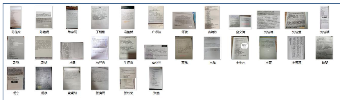
学生提交的作业截图

利用讨论话题，提高学生讨论的积极性，对于学生的回答，进行一一点评；对于学生的疑问，都会一一答复，答对的学生给与鼓励，未答对或者答非所问的同学给予正面引导。