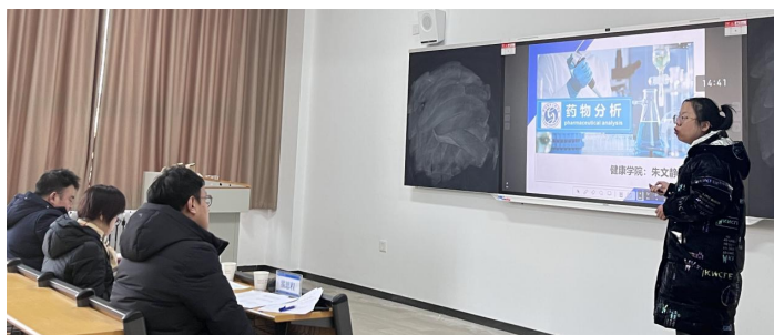
图 5、6 新进教师教学能力展示评比大赛现场