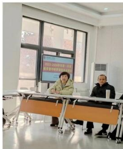
项莉老师反馈听课情况