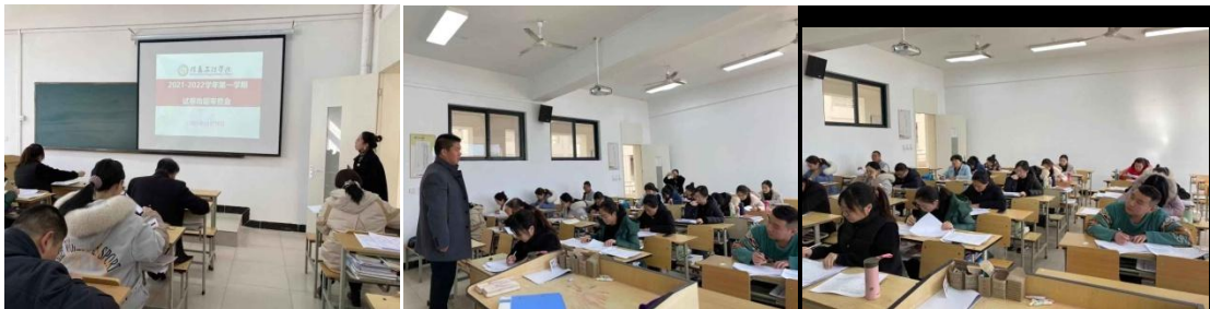
信息工程学院期末考试命题审核会场景

考试结束后，学院安排各系组织教师召开了主题会议，就本次试卷的命题及自己作为考生答卷过程中的感想进行了讨论交流。交流中，教师反应非常强烈。教师说转换角色，只有在自己答题中才能真正发现问题，诸如有些题量过大，有些又过小；有些题目过难，有些又过于简单；有些题意表达不明确，有些题目赋分不合理，甚至有些试卷出现信息错误等等。真正置身于学生角色去考试的时候，才能发现试卷的合理性，才能再次回顾检查自己整个学期的教学各个环节。答题过程是自己对照检查的一次绝好机会，对后期教学改革及教学质量的提高大有裨益。教师们感慨：这场“特殊的考试”，既是一场命题审核会，也是一场命题培训会，大家受益匪浅。