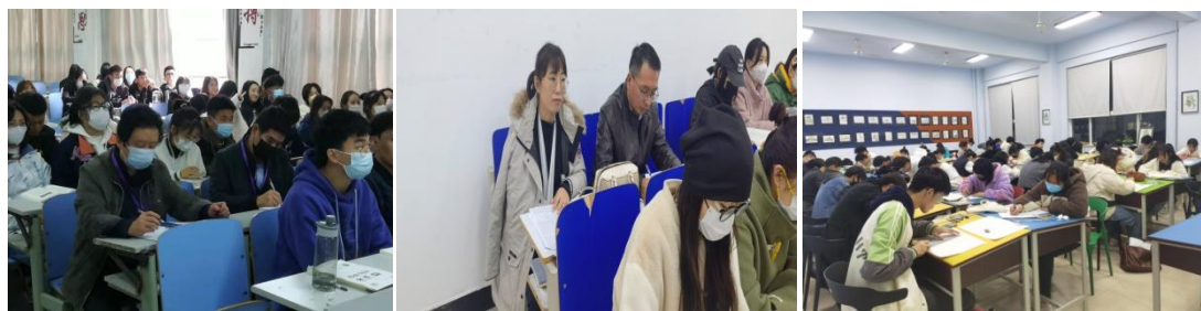
教学督导巡课、听课部分场景

习的自主性问题。对一些应用性、实践性比较强的课程，学生需要利用晚自习时间在实验室、图书馆自主学习，但统一上自习使学生没有自主学习时间。（3）后勤保障方面：教学设备老化问题。有些机房设备陈旧老化，许多软件无法装载；教室多媒体设备出现故障，维修不及时，影响正常教学。师生饮水问题。一方面，冬季师生对热水的需求量比较大；另一方面，A-E区院系比较多，学生比较集中，饮水机太少，加之设备还经常坏，热水供不上。环境卫生问题。有些教室、卫生间的卫生状况比较差。