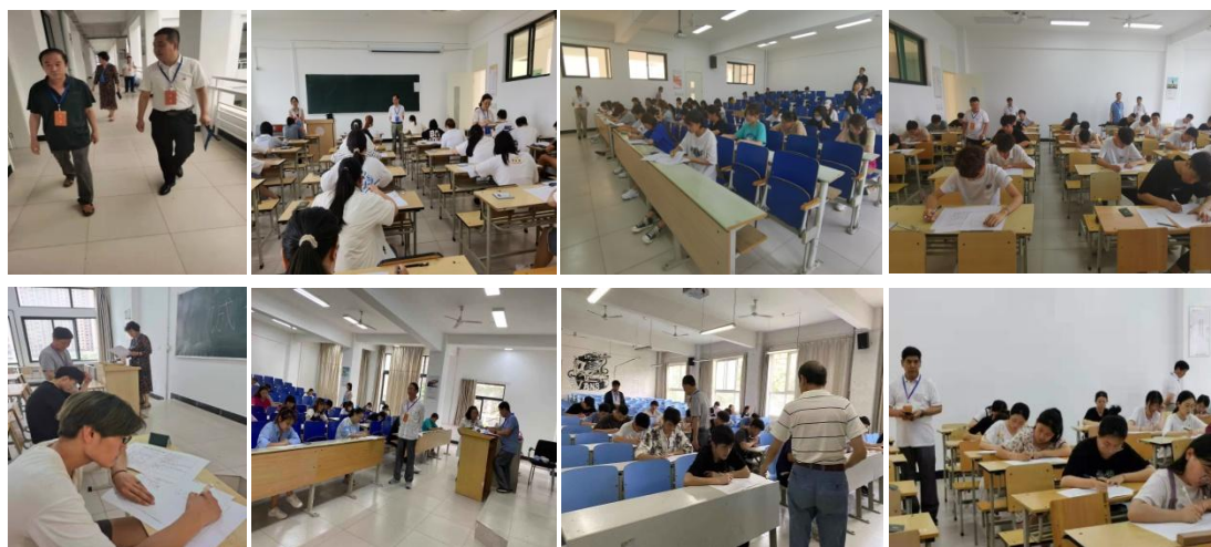
期末考试巡考部分场景

记录单》填写完毕，不符合规定；考生中途上厕所无人陪同。（5）有些专业的专科学学生缺考人数过多，个别班级多达 10 人。（6）个别考场卫生很差，过道、座位下纸片、饮料瓶等垃圾很多，有些垃圾集中堆放在墙角，环境脏、乱、差。这些问题需今后进一步改进。