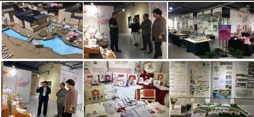
艺术设计学院 2021 届本科毕业生毕业设计作品展场景