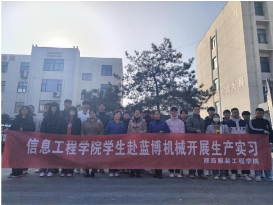
图6 学生在蓝博机械有限公司合影