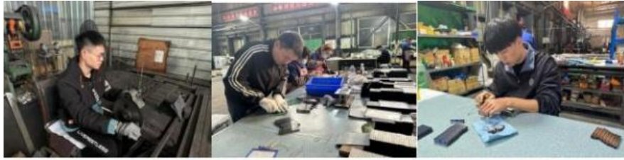
图5 学生分配到岗开展实习