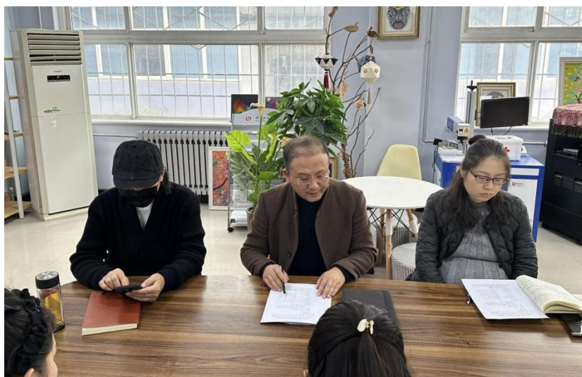
时院长解读评估要求

吴院长强调，此次教学合格评估工作推进会对于促进学院高质量发展具有十分重要的意义。全院上下要高度重视、正确认识，严格按照工作部署，层层落实，责任到人，着力推进合格评估工作顺利进行。