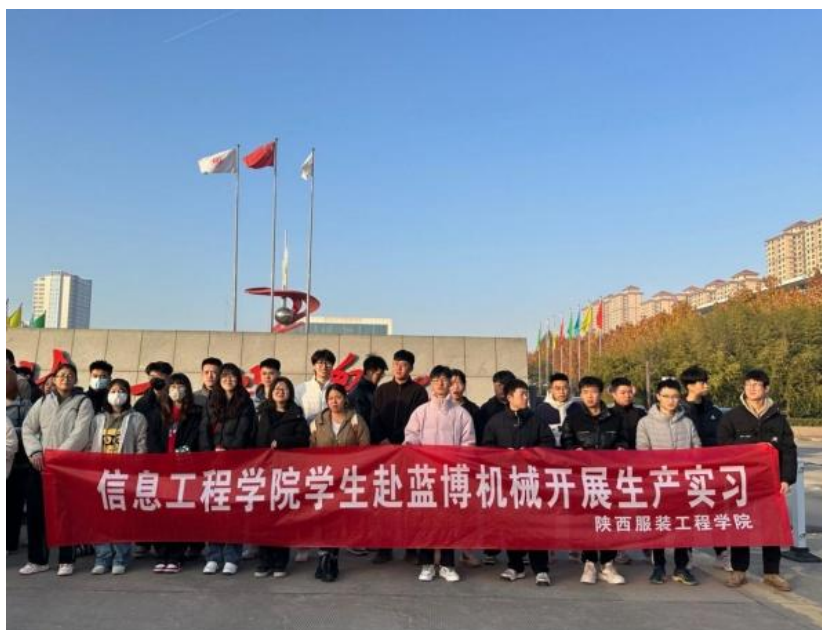
图 1 学生赴蓝博机械开展生产实习合影

学生赴实习基地前，副院长常利群、学院党委副书记罗雄、实验室主任陈江萍亲自到校门后欢送同学们，现场再次强调了安全问题，同时强调了生产实习的重要性，提出了实习内容、纪律、安全等方面的要求，实习指导教师全程带队。