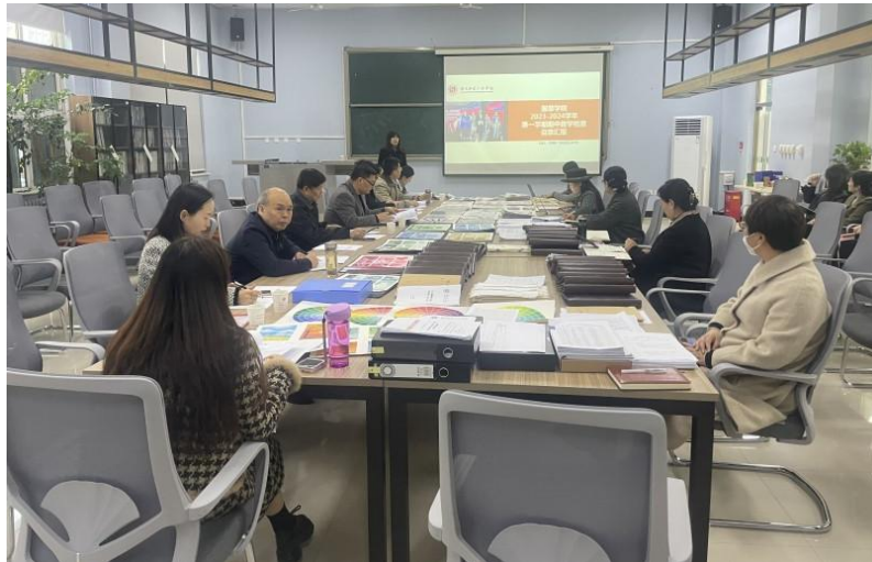
图1 督导组成员参加服装学院期中教学检查现场