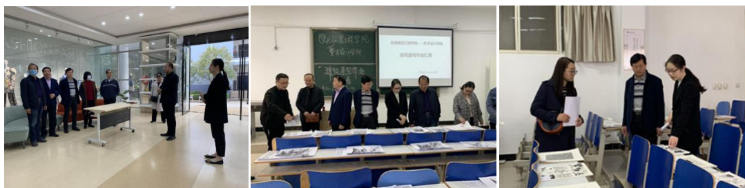
学校领导莅临艺术设计学院观看作业汇展并指导工作

校领导细心观看了此次展览，并对学生的作品给予了充分的肯定，希望艺术设计学院不断总结教学改革经验和不足，在今后开展更多形式的实践教学活活动，培养出更多实践能力强，专业能力优，符合社会发展的高素质应用型人才。