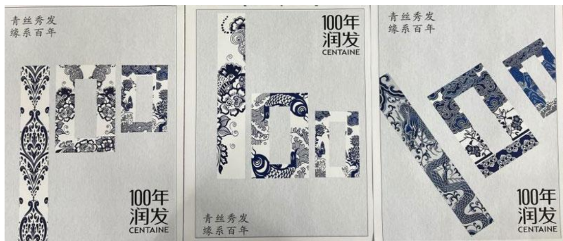
广告艺术设计班部分优秀作业展示