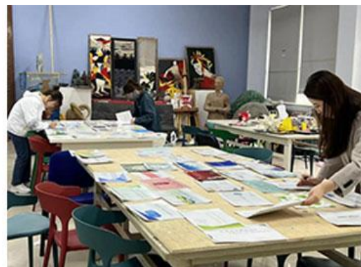
结课作业汇看现场