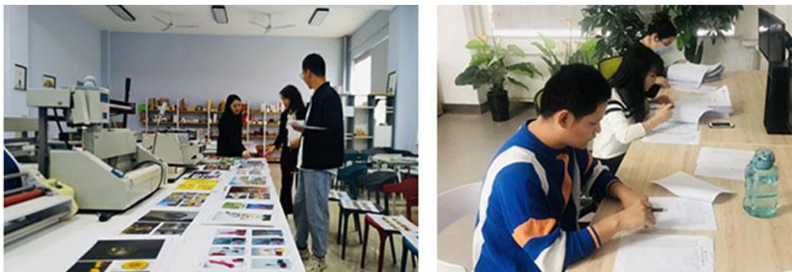
结课作业汇看现场

本次参加作业展的课程包括《摄影基础》、《电商网页设计》、《广告设计》、《书籍装帧》、《设计调研》等专业课程，参与学生作业百余份。