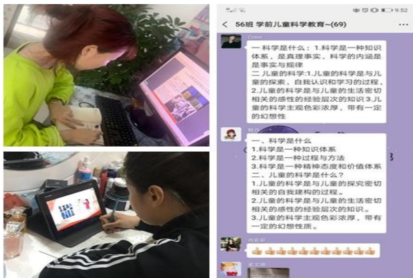
学生在线学习及交流实录

从开学第一天的整体效果来看，学生对线上教学的积极性很高，我校学生能够与时俱进，踊跃参与。他们在线上开展热烈的研讨，提前进入“云课堂”、利用在线课程资源、图书馆电子资源等途径进行自主学习。一些同学表示：“线上学习提供了非常多的资源，可以课前预习，上课更有针对性。锻炼了自主学习能力，自己查阅资料、解决问题，收获颇多”。