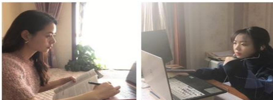
服装学院教师线上教学实录

学校董事会、校委会高度重视，在疫情防控工作领导小组的统一安排下，自2月1日以来，教务处会同各相关职能部门召开视频会议，科学谋划，抢先部署，全力保障，做好服务；各二级教学单位根据教务处安排的线上教学任务，统筹协调、克服困难；全体参与线上教学的教师加班加点，倾心准备，齐力打赢学校抗“疫”时期在线教学攻坚战。