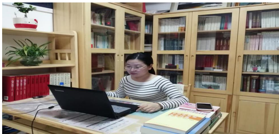
思政课教师线上教学实录