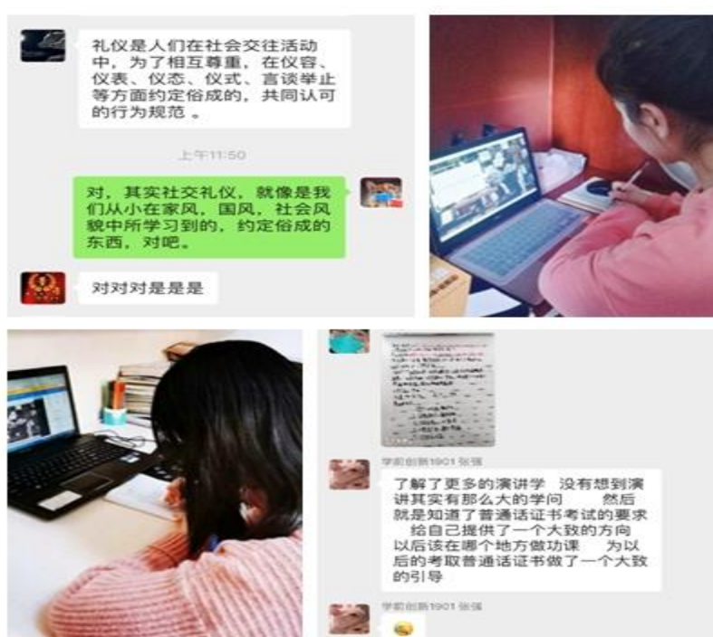
学生在线学习及课堂讨论实录

本次教学模式的革新对师生们来说是挑战也是学习成长的机遇，各学院教师积极参与线上授课，部分年龄较大的教师以乐观好学的态度主动承担线上教学任务。以学院为单位，坚持一院一策的方针，经过反复探讨、优化筛选课程资源和授课模式，尽力做到课堂质量不打折。在课程准备阶段，教师提前分享给学生学习课件、课程设计及相关教材等资料，同时在“陕服云”平台进行建课、设置学习任务及测试环节，充实课程内容，拓宽课堂知识面，将严肃与活泼、传统与革新、单一与多元相结合。