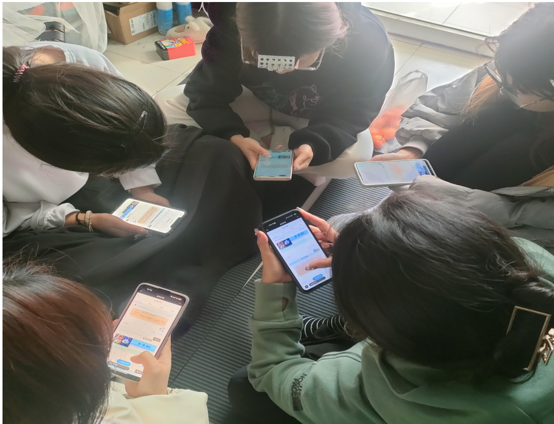
护理 20 级学生认真听课